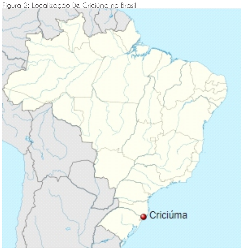
Mapa esquemático do Brasil