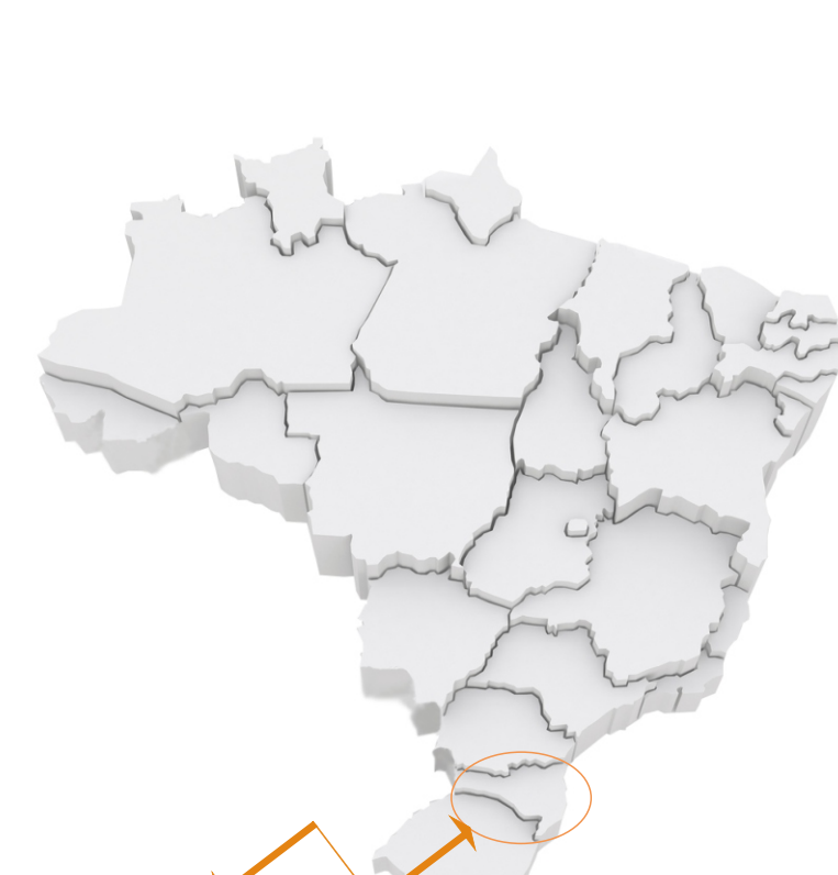
Mapa esquemático do Brasil com localização de Santa Catarina

Criciúma é um município brasileiro, conforme figura 02, situado no Estado de Santa Catarina, região Sul do país, conforme figura 03. Conhecida por ser a Capital Brasileira do Carvão e do Revestimento Cerâmica. Com mais de 200 mil habitantes (IBGE, 2010), é considerado principal cidade do sul catarinense. Sendo a maior e mais propícia dentre os municípios da AMREC, conforme figura 03, a receber um Centro de Reabilitação para Amputados e Prática Esportiva.