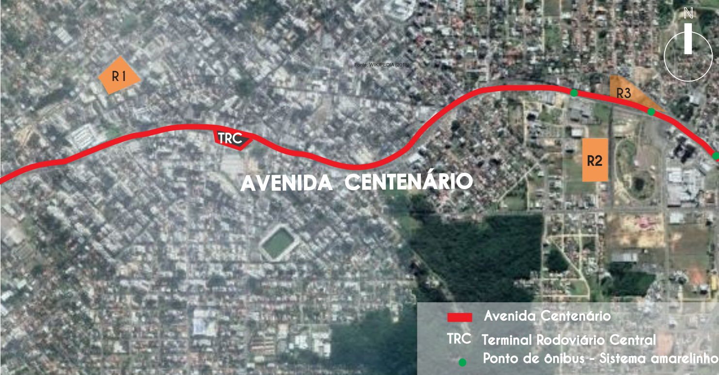
Mapa do Recorte / Área de Estudo