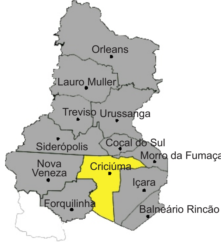
Mapa esquemático da AMREC